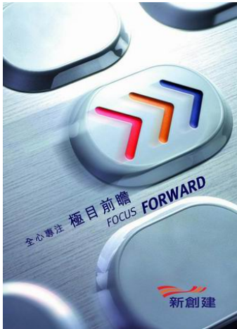
新創建集團員工季刊—《新語世說》封面